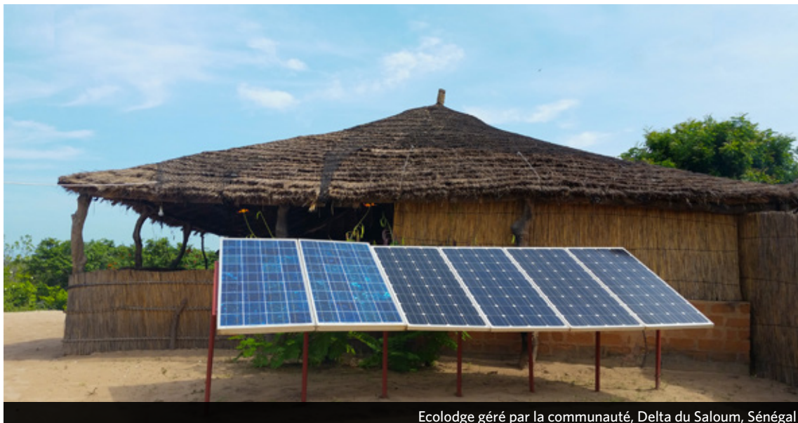
Ecologe géré par la communauté, Delta du Saloum, Sénégal