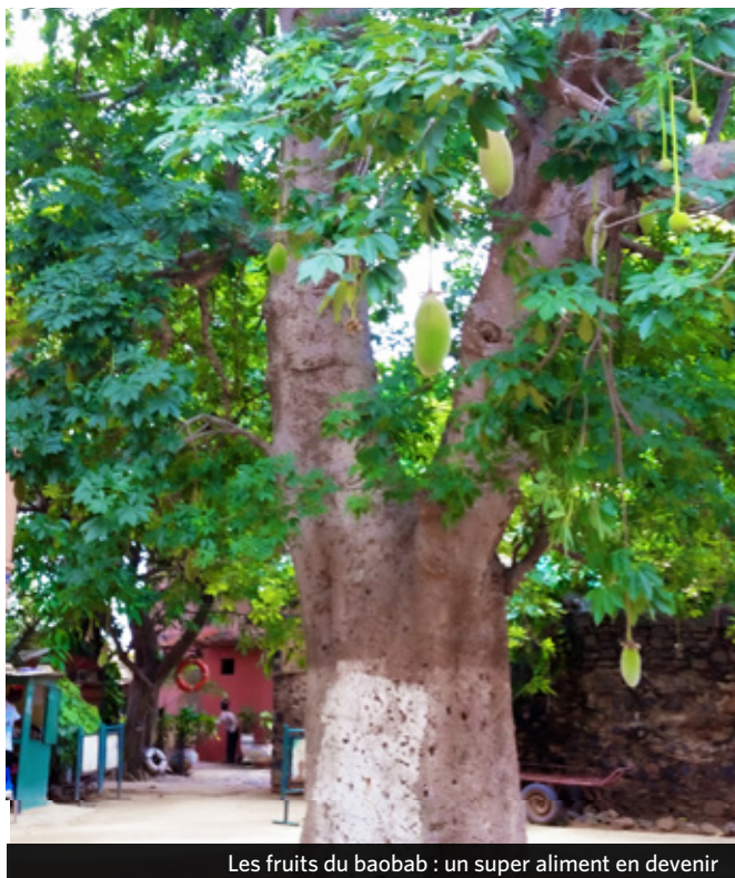
Les fruits du baobab : un super aliment en devenir

Le patrimoine est encore trop souvent considéré comme impacté négativement par le changement climatique et comme devant être protégé (voir par exemple le rapport de synthèse des discussions de la COP25 3 ). Cependant, le patrimoine, en particulier ses manifestations immatérielles, est une ressource qui peut apporter des solutions innovantes pour atténuer le changement climatique et les catastrophes associées. Comme déjà souligné, cela ne se produira pas tant que les peuples autochtones et les populations locales continueront d'être stéréotypés, considérés comme appartenant au passé et comme n'ayant aucune connaissance. Tout en reconnaissant les connaissances autochtones et les approches traditionnelles, il ne faut pas oublier qu'elles ne sont pas statiques mais qu'elles évoluent constamment. Dans le delta du Saloum au Sénégal, par exemple, j'ai rencontré des personnes qui ont essayé et testé différentes espèces d'arbres endogènes pour évaluer comment elles peuvent résister et s'adapter aux changements environnementaux et climatiques, et aux compositions modifiées du sol.