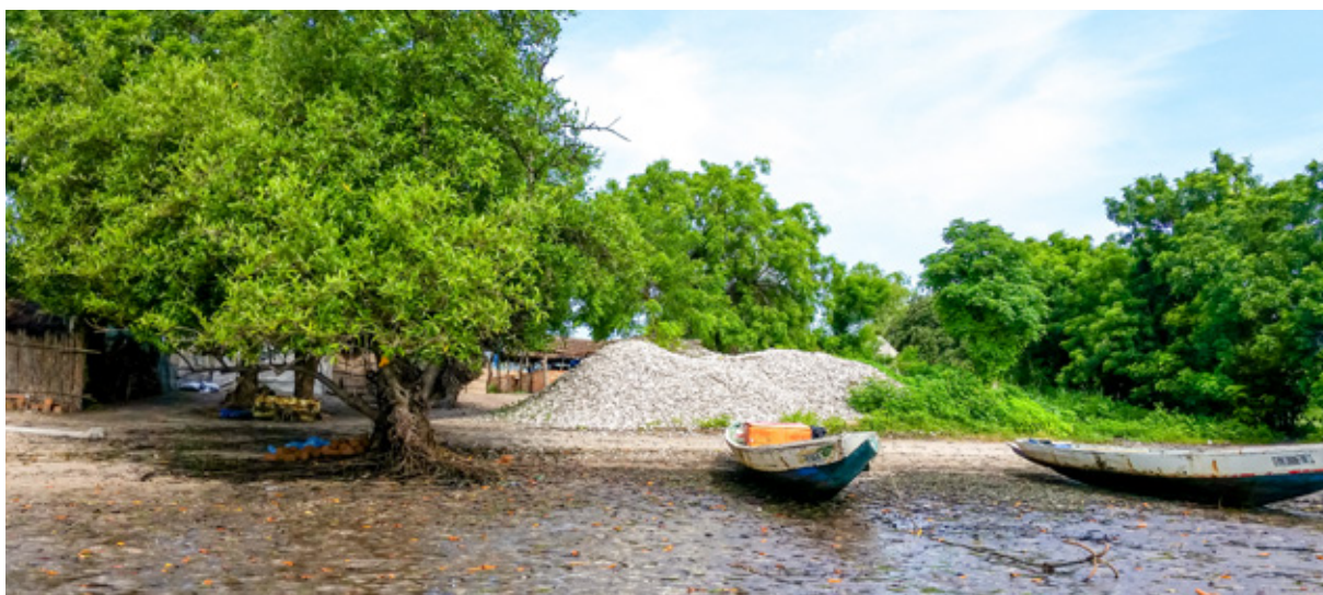
Delta du Saloum, Sénégal, illustrant l'inséparabilité de la nature, de la culture, du matériel et de l'immatériel