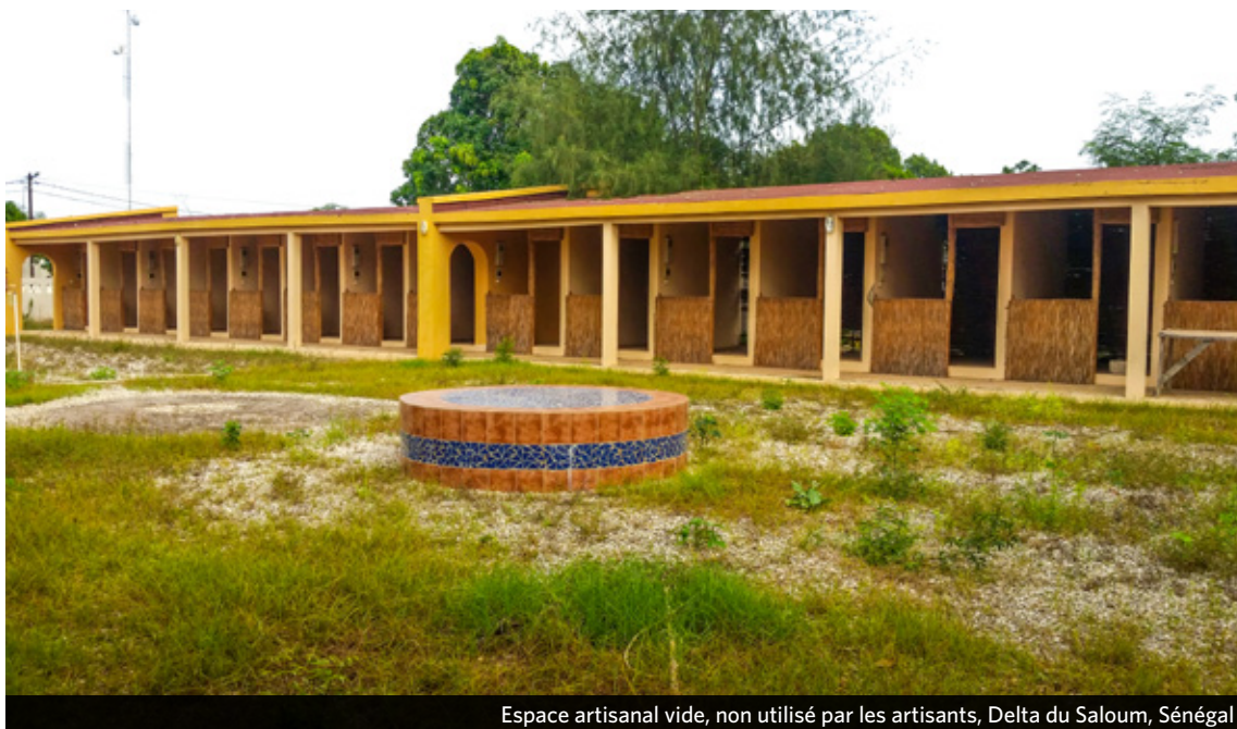
Espace artisanal vide, non utilisé par les artisans, Delta du Saloum, Sénégal