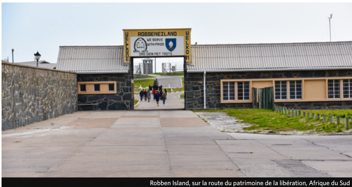
Robben Island, sur la route du patrimoine de la libération, Afrique du Sud