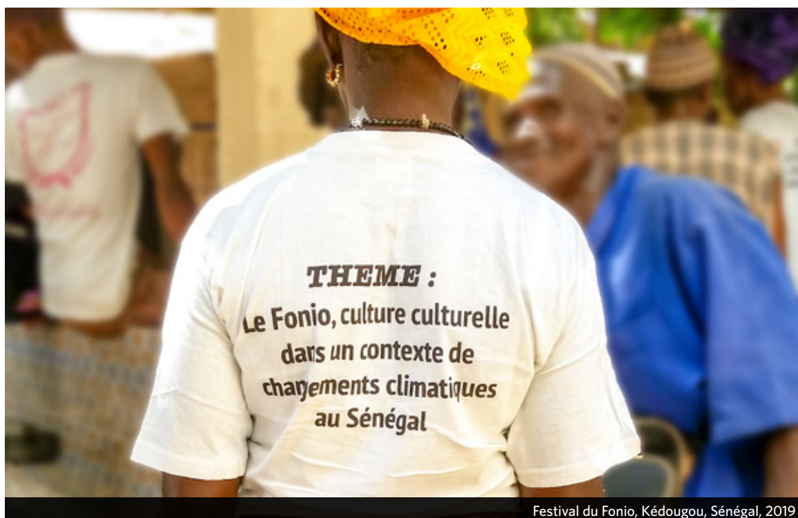
Festival du Fonio, Kédougou, Sénégal, 2019