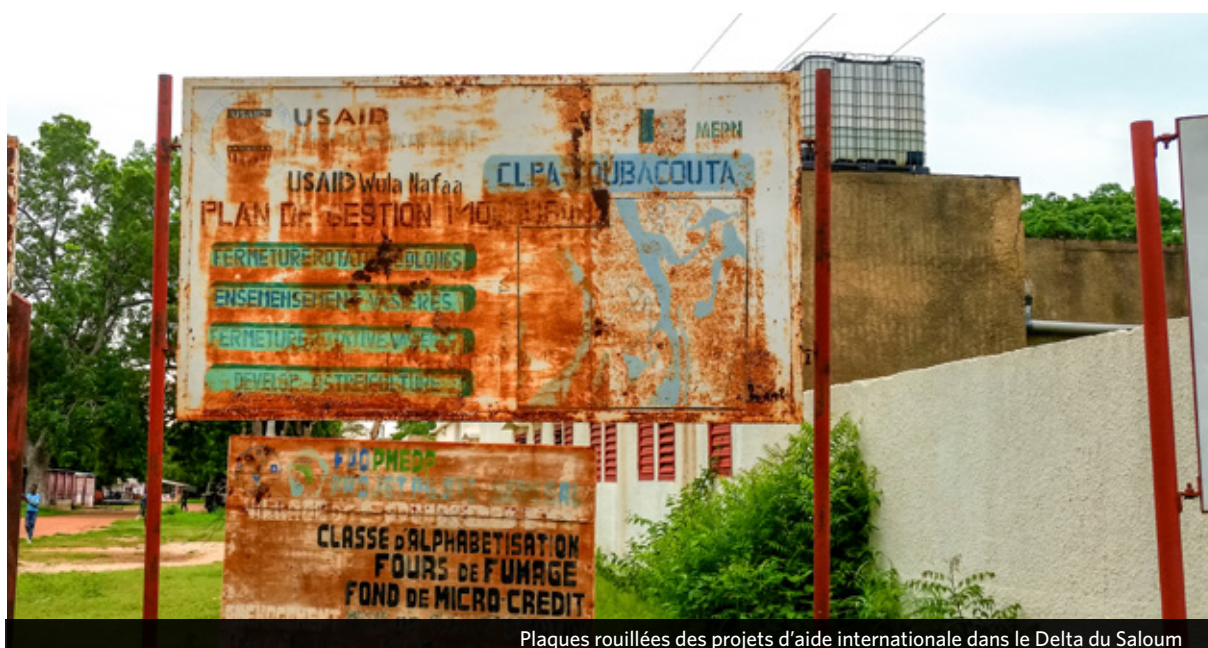
Plaques rouillées des projets d'aide internationale dans le Delta du Saloum