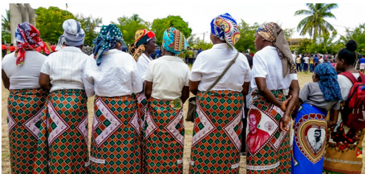
Journée de la femme mozambicaine (Inhambane, 2019), un événement public pour les revendications politiques et sociales