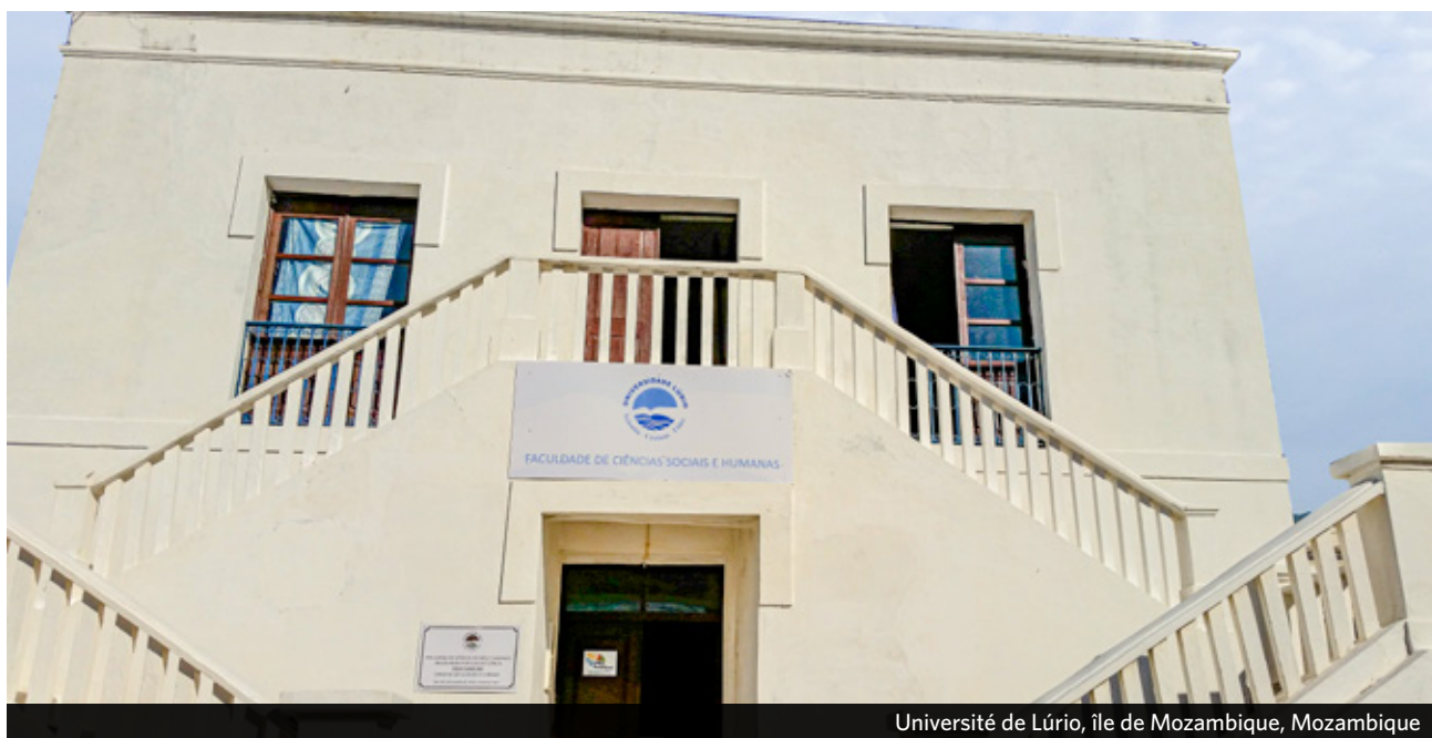
Université de Lúrio, île de Mozambique, Mozambique